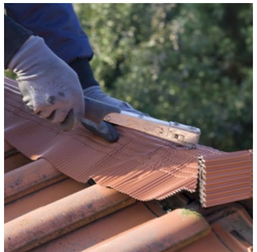
Mittig nageln oder antackern