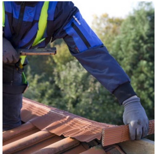
Ausrollen über den First