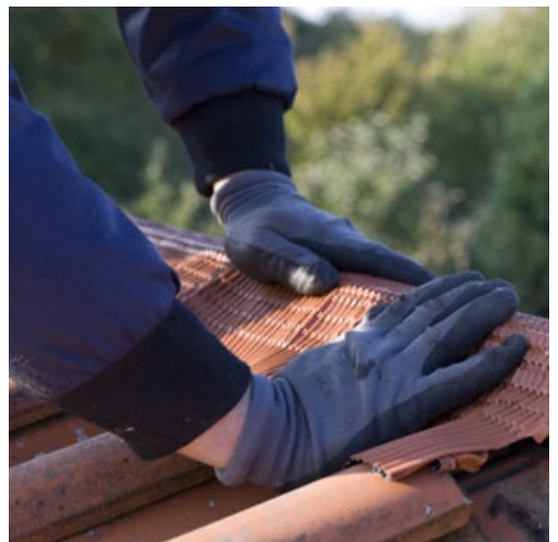
Anformen, kein Kleben notwendig