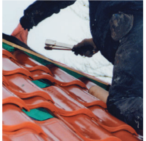
Dérouler au-dessus du faîte