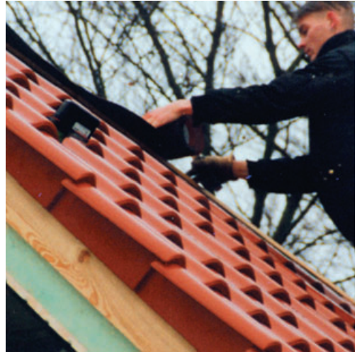
Clouer ou agraffer centrée