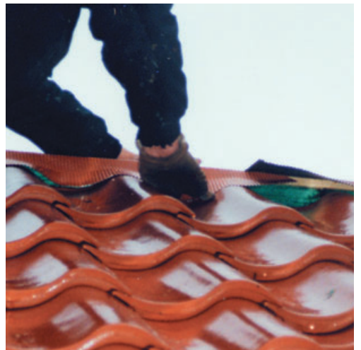
Donner la forme, pas de collage nécessaire