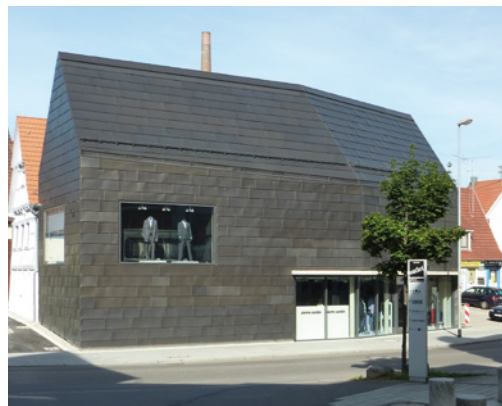
Venusblei-Fassade am Pierre Cardin-Outlet in Metzgingen.

Venusblei eignet sich für Abdichtungen an Dach und Fassade ebenso wie zur Verlegung auf großen Flächen. Die Verarbeitung entspricht der von unbehandeltem Walzblei: Alle gängigen Falztechniken sowie Löt- und Schweißen sind möglich.